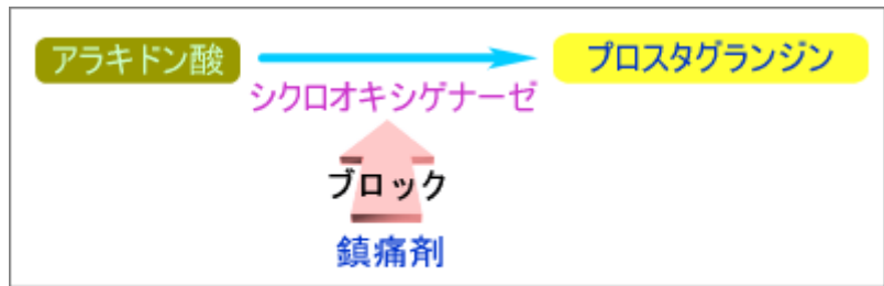
痛みの原因物質が出来る仕組みと鎮痛剤

市販のバファリンやイブなどの鎮痛剤は痛みの物質が作られる過程をブロックすることによって効果を発揮します。出来てしまった後の痛みの物質そのものには効き目がありませんので、痛みの物質がたくさん作られる前に使用しないと効かないということになります。